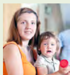
Отдел опеки и попечительства Понедельник с 10:00 до 12:00 Четверг с 15:00 до 17:00